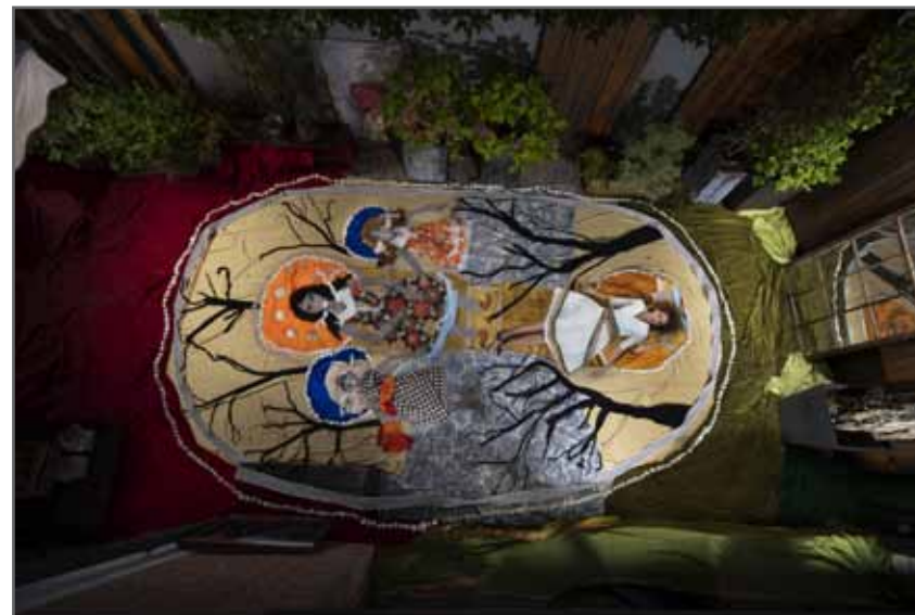
Leila Slimani

Une mise en scène de l'imaginaire qui émerge dans le quotidien, comme le moment du livre ouvert : le lien entre son travail et celui des bénévoles a été évident pour tous.