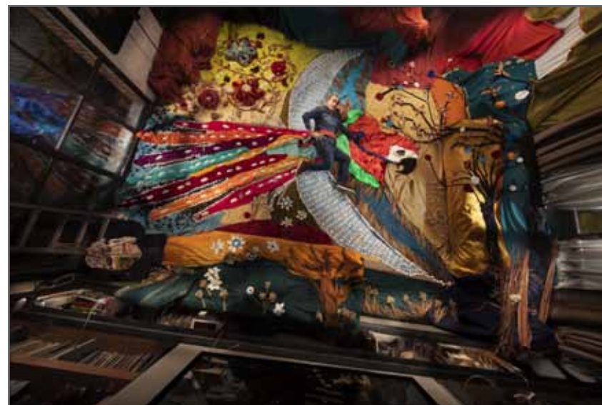
François Morel